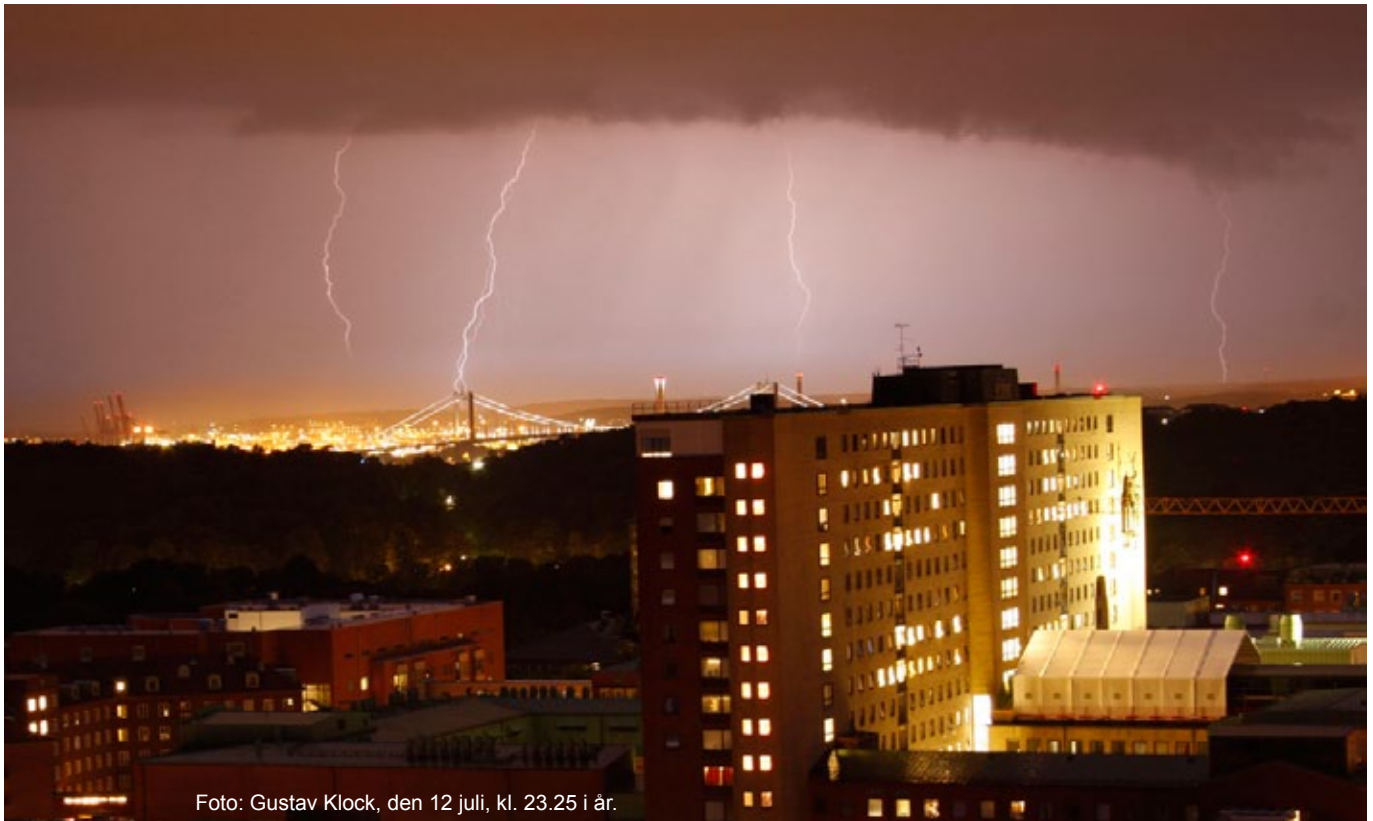
den 12 juli, kl. 23.25 i år.